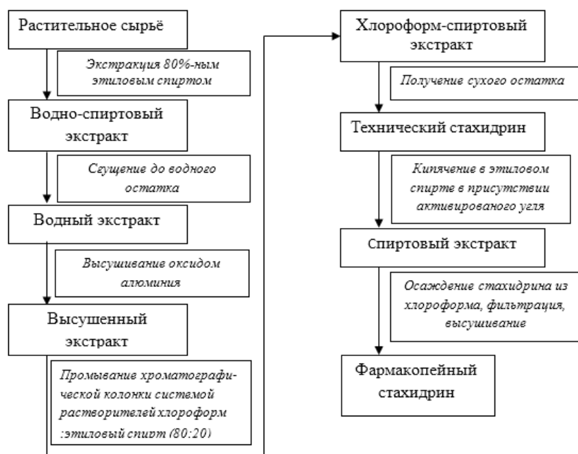
Рисунок 1. Блок-схема получения субстанции алкалоида стахидрина

На основе этой блок-схемы в Опытном производстве Института химии растительных веществ монтирована линия по производству субстанции стахидрина (рис.2)