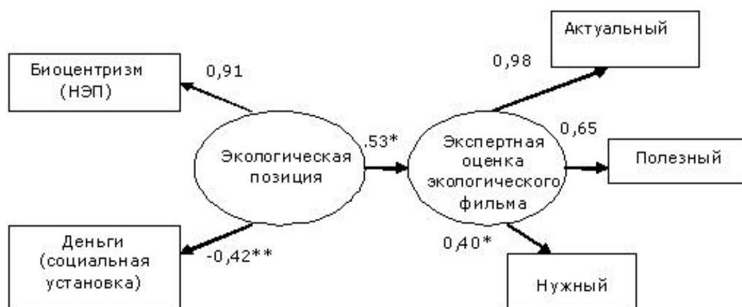
Рисунок 1. Модель влияния экологической позиции на экспертную оценку экологического фильма (метод ADFG; \chi^2/df=2,7/4 ; p=0,61 ; RMSEA 0; GFI 0,97; AGFI 0,90; связи значимы при p < 0,001 , кроме * p < 0,01 и ** p < 0,05 )

По результатам путевого анализа модель влияния экологической позиции на когнитивный компонент отношения к экологическому фильму в целом подтвердилась: практически все основные показатели пригодности модели превышают пороговые величины, за исключением индекса AGFI, который тем не менее попадает в диапазон приемлемых значений (0,90—0,95). Значимым ( p < 0,01 ) оказался показатель влияния экологической позиции на интегральную экспертную оценку.