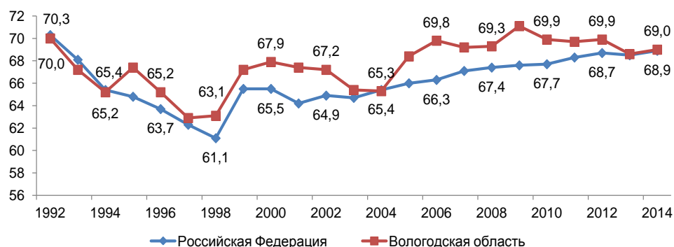
Рисунок 2. Уровень экономической активности населения (в %)

Как видно из рисунка 2, в период с 1990 по 1998 г. динамика уровня экономической активности населения Вологодской области имела отрицательный тренд (с 67 до 57 % и с 67 до 60 % соответственно), что было связано с распространением неофициальных (неформальных) форм занятости, увеличением масштабов открытой безработицы вследствие кризисных явлений в экономике и снижения спроса на рабочую силу.