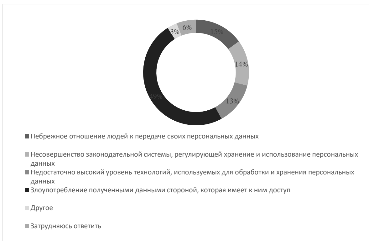
Рисунок 2. Процент соотношения причин утери персональных данных по мнению россиян

Возникает вопрос о том, почему же у населения такое сомнение в силе закона. Рассмотрим, как в в Российской Федерации регулируется обеспечение сохранности ПД на правовом уровне детальнее.